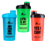
Шейкеры, бутылки, контейнеры