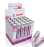
Витамины и минералы